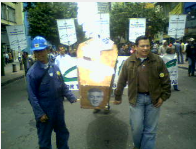
Trabajadores de la ETB agremiados en Atelca y Sinrateléfonos acuden al sepelio del más importante patrimonio de los Bogotanos, gracias a los buenos oficios del Alcalde Distrital, elegido con el voto del POLO.

Masivamente salieron trabajadores sindicalizados de la Empresa de Teléfonos de Bogotá que agrupan Atelca y Sinrateléfonos denunciando y sentando su posición frente al interés de la administración distrital en buscar socio privado que compre el mayor paquete de acciones posible, poniendo en entredicho la estabilidad laboral de sus trabajadores y el patrimonio de todas las y los Bogotanos, propietarios soberanos de la Empresa en tanto se ha consolidado con el pago tarifario puntual y el esfuerzo laboral de los obreros bogotanos desde que fue adquirida a los ingleses en 1940.